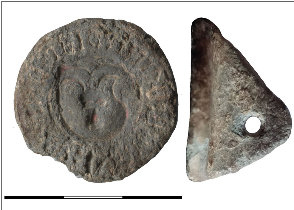
Ryc. 4. Myślino (pow. kołobrzegi). Średniowieczny typariusz odnaleziony na terenie siedziby rycerskiej.

Tłok ma średnicę 2,8 cm, grubość 0,4 cm, a wysokość całkowita (ze strzemiączkiem) wynosi 1,7 cm, jego waga to 22 g. Na odwrocie przedmiotu znajduje się trójkątne, pionowe strzemiączko z otworem do przewleczenia sznurka/rzemienia. Na tłoku widnieje wizerunek rycerskiej tarczy turniejowej z bocznym bouche (wycięciem na kopię) 9 . Na tarczy zaś widoczny jest łeb kozła na wprost. Napisu, oddzielonego liniami otokowymi, niestety nie udało się odczytać (ryc. 4).