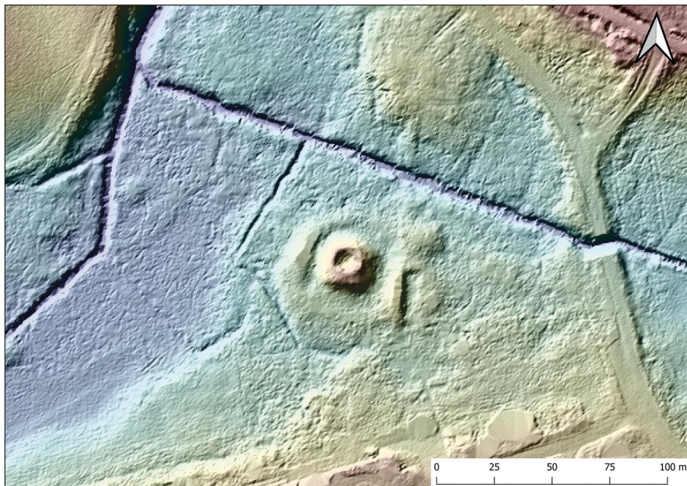
Ryc. 2. Myślıno (pow. kołobrzeski). Wizualizacja ziemnych pozostałości późnośredniowiecznej siedziby rycerskiej. Oprac. G. Kiarszys

Dzięki dofinansowaniu uzyskanemu od Wojewódzkiego Urzędu Ochrony Zabytków w Szczecinie zrealizowano projekt pn. Zamek Moiselin. Nieznany element średniowiecznego krajobrazu kulturowego gminy Gościno , którego jednym z elementów było przeprowadzenie rozpoznania potencjalnej siedziby rycerskiej poprzez wykonanie odwiertów 2 , a także prospekcji terenowej i poszukiwań za pomocą detektorów metali w celu pozyskania zabytków zalegających w warstwie humusu 3 .