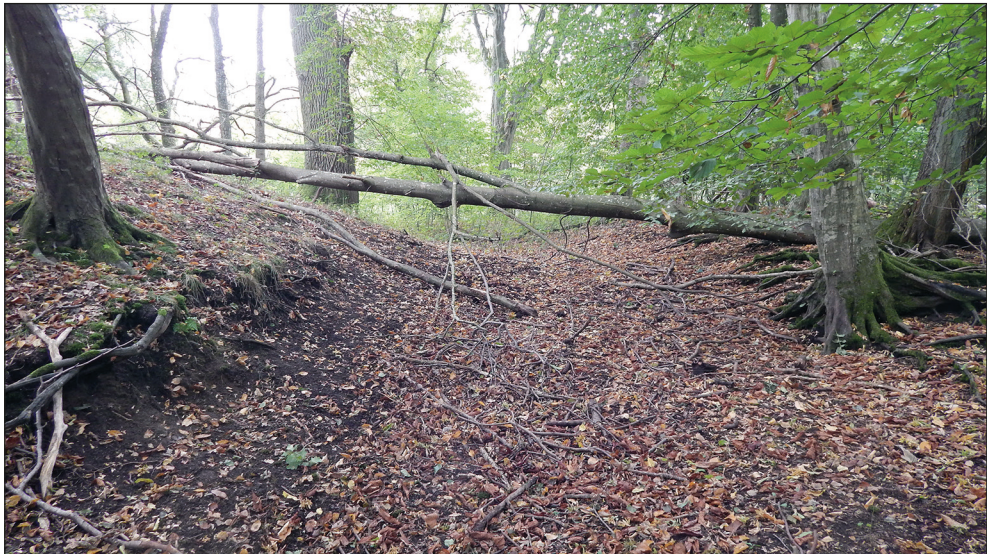
Ryc. 1. Myślino (pow. kołobrzegi). Widok na fosę i kopiec.

Jedną z potencjalnych siedzib obronnych udało się denazyfikować na gruntach wsi Myślino. Niewielka wieś Myślino (niem. Moitzlin ) położona jest około 20 km na południe od Kołobrzegu, nad ciekim wodnym Gościnką, znajduje się ona w granicach obecnej gminy Gościno (pow. kołobrzegi, woj. zachodniopomorskie).